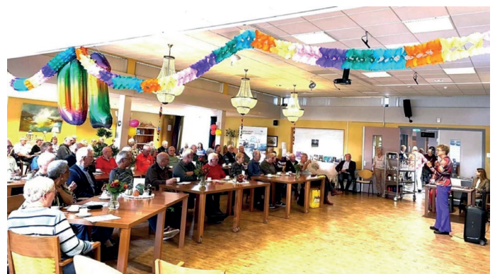
Indruk van de jubileumbijeenkomst

Het team van het Parkinson Café hoopt dit jaar de volgende thema's aan de orde te stellen: mantelzorg en de mantelzorgmakelaar, Parkinson en seksualiteit, Parkinsonisme, Parkinson en beweging (dansen, boksen, wandelen), afasie (problemen met taal) en apathie (lusteloosheid).